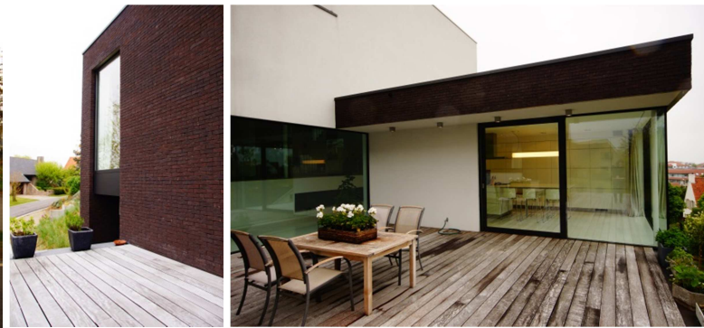
Woning Dekinder – Staelens