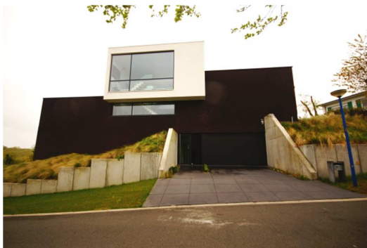
Architectuurprijs Koksijde 2013